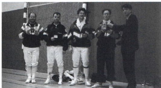
Sabel gemengd senioren

Op 3 en 4 mei jl. werd in Zoetermeer geschermd om de Bevrijdingsbeker en Het Wapen van Zoetermeer. Hierna volgen de uitslagen en foto's van de winnaars: