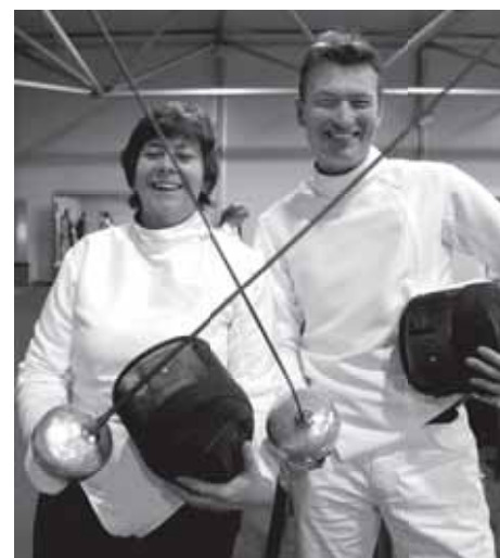
NOC*NSF/Erwin te Bokkel